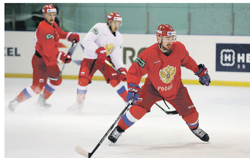
Дмитрий Коротаев / Иллюстрация

Таким образом, Россия и Чехия обогнали себе жизнь, удержавшись в Братиславе.