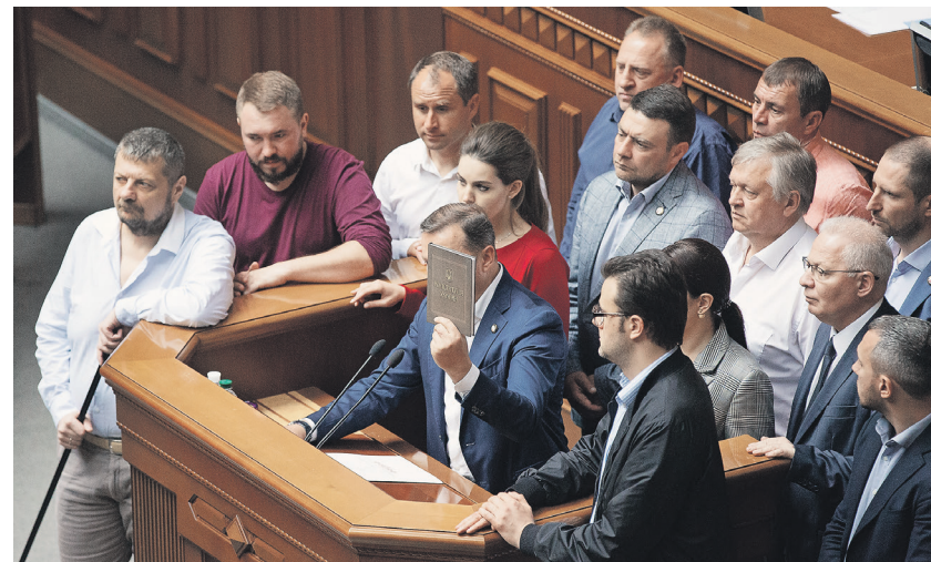
Верховная рада Украины выступила против первого закона Владимира Зеленского о выборах