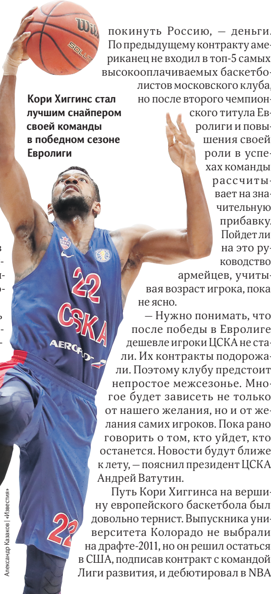
Александр Каломин / Иллюстрация

Кори Хиггинс стал лучшим снайпером своей команды в победном сезоне Евролиги