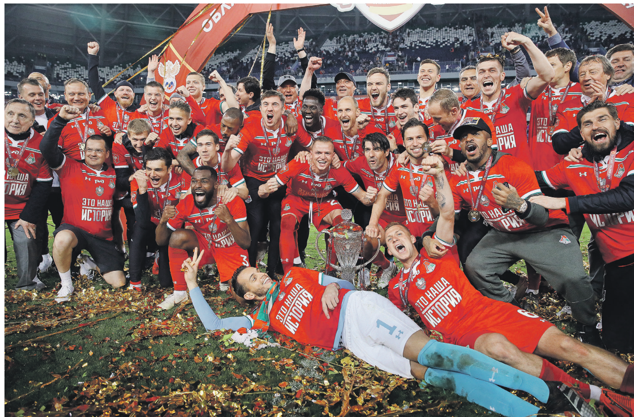
Александр Мамин / Иллюстрация